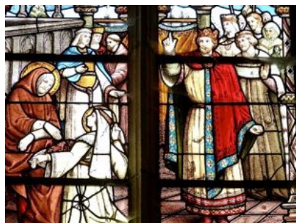
Saint Longin et Sainte Onofre