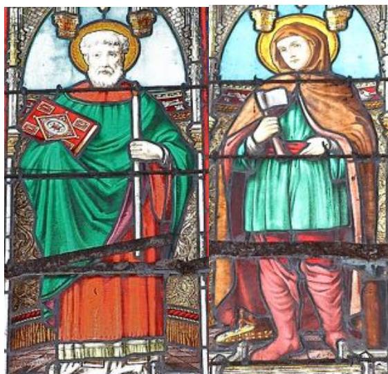
Saint Rigomer et Saint Viventien

Au cœur de notre paroisse, l'église Notre-Dame de Mamers se distingue avant tout par son unité de style et son harmonie architecturale en dépit de ses transformations successives entre le XVe et le XIXe siècle.