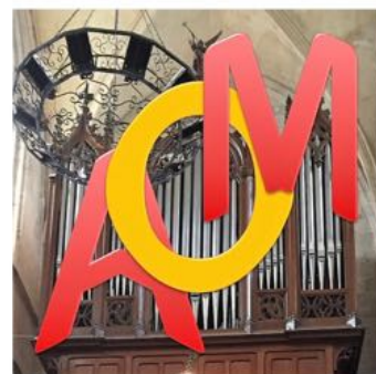
les amis des orgues de Mamers

Le concert du jour de l'orgue prévu pour le 9 mai est reporté au dimanche 13 juin 16h00 en raison de la pandémie. Nous vous attendons nombreux. Le facteur d'orgue pourra nous entretenir au sujet du relevage de l'orgue. Cet orgue aura 120 ans.