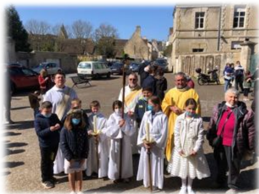
Sortie de messe avec des enfants du caté Pâques 2021

C'est dans cette dynamique que le service diocésain de la catéchèse cherche à apporter des réponses aux nouvelles questions qui se posent sur l'annonce de l'Evangile auprès des enfants en paroisse ».