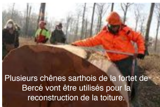
Plusieurs chênes sarthois de la forêt de Bercé vont être utilisés pour la reconstruction de la toiture.

Deux ans après l'incendie du 15 avril et cinq mois après la dépose de l'échafaudage calciné, le chantier de Notre Dame de Paris suit son cours. Quelques échos de la restauration.