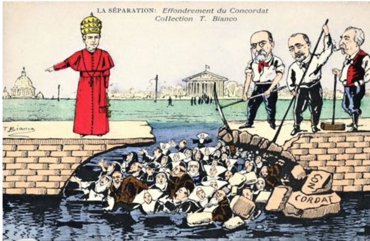
Gravure satirique de l'époque sur la séparation de l'Eglise et de l'Etat