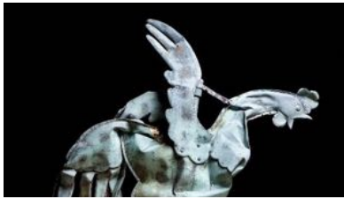
Coq ND de Paris

Ce coq, créé par l'équipe de Viollet-le-Duc au XIX e siècle, contient depuis sa restauration en 1935 des reliques de la Couronne d'épines, de saint Denis et de sainte Geneviève, affirmant ainsi sa fonction de « paratonnerre spirituel » 2 .